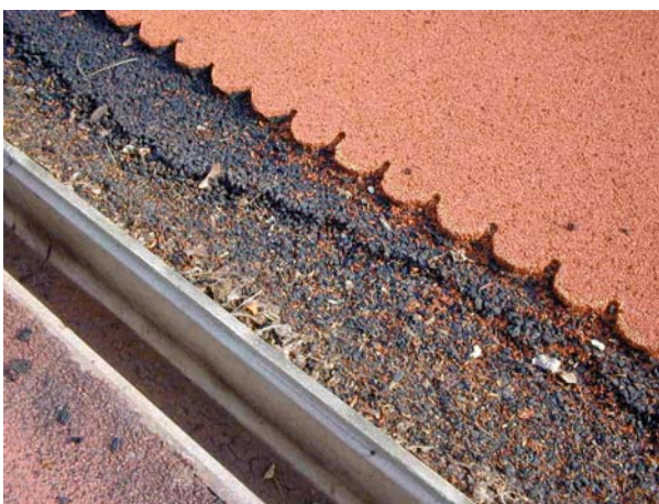
Rénovation de l'infrastructure et des bordures