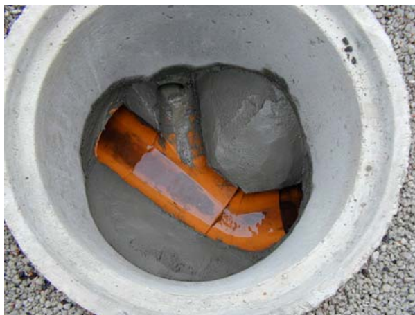
Sondages et installation d'un regard de visite supplémentaire