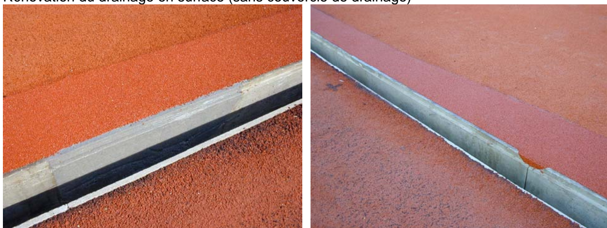
Rénovation du drainage en surface (sans couvercle de drainage)