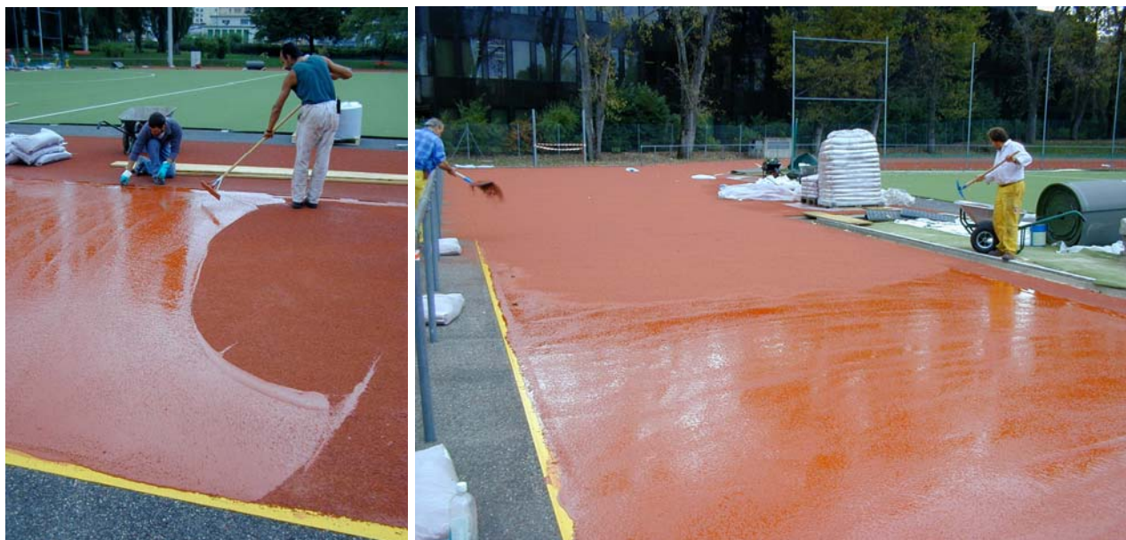
Application du polyuréthane chargé de granulats de caoutchouc sur la piste