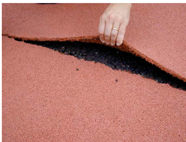
Présence de racines sous la piste