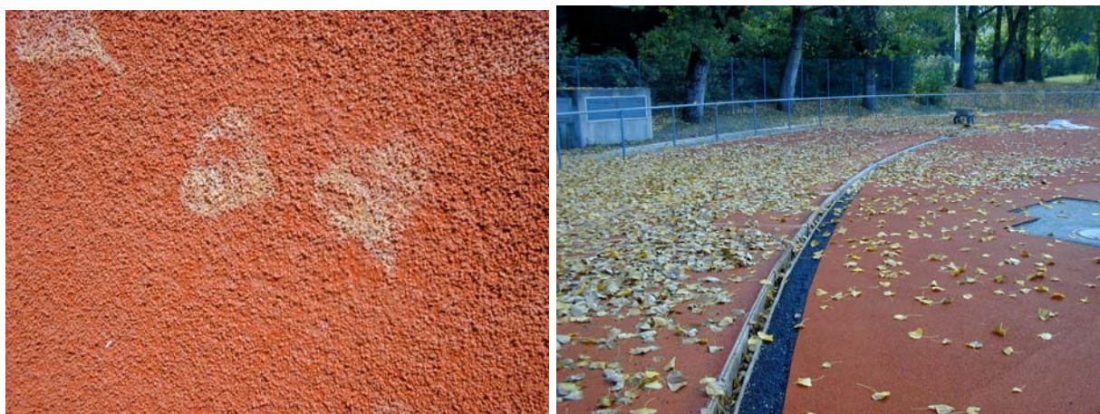
Réaction chimique des feuilles mortes sur le nouveau sol