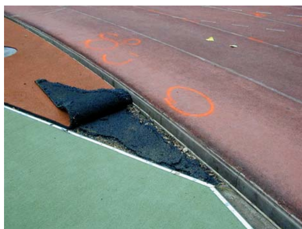
Décollage des synthétiques dû à un enrobé bitumineux insuffisamment compacté