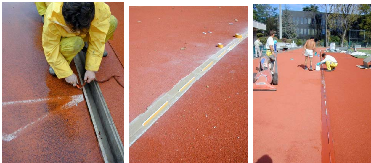
Rénovation du drainage en surface (sans couvercle de drainage)