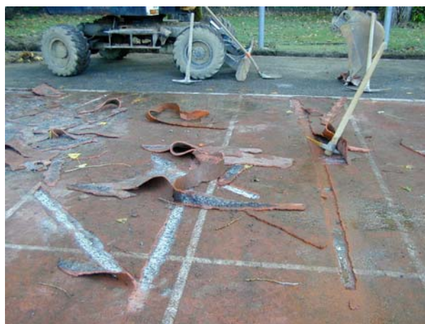
Décollage /Arrachage du revêtement