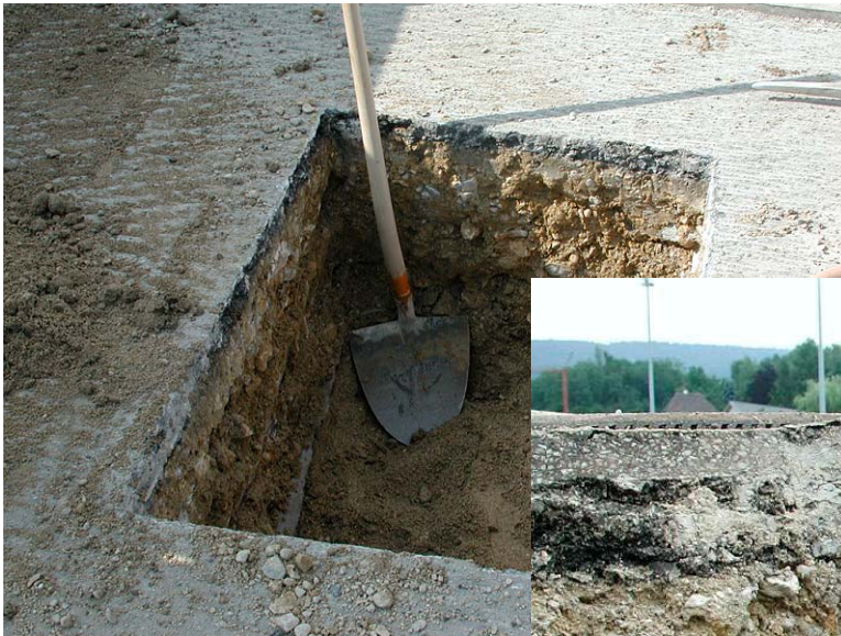
Sondages du support