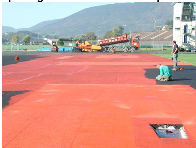
Application du bouche pore et le treillis (grille) de renforcement