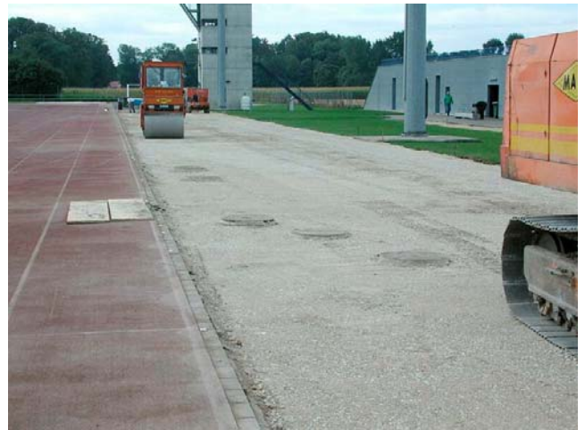
Infrastructure du nouveau saut à la perche