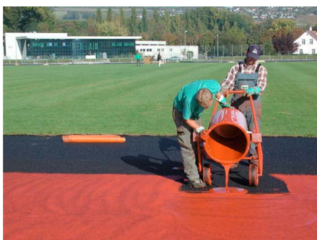
Spatulage de la sous couche souple