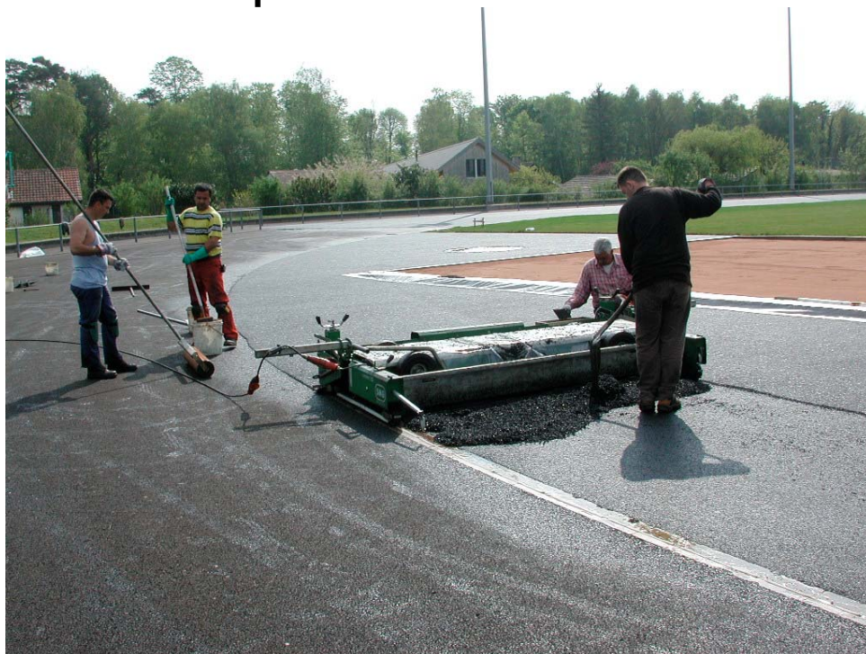
Sous couche poreuse et élastique