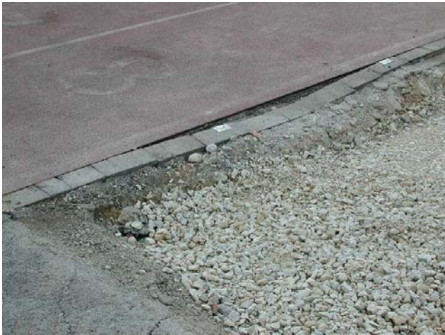
Remplacement de bordures