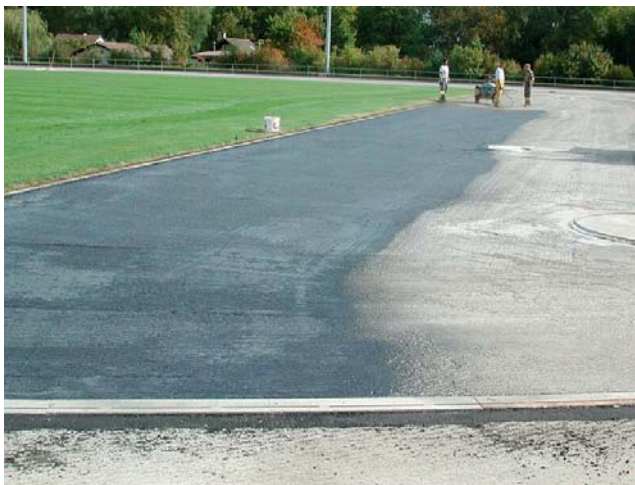
Pose du nouveau support un béton bitumineux, perméable à l'eau